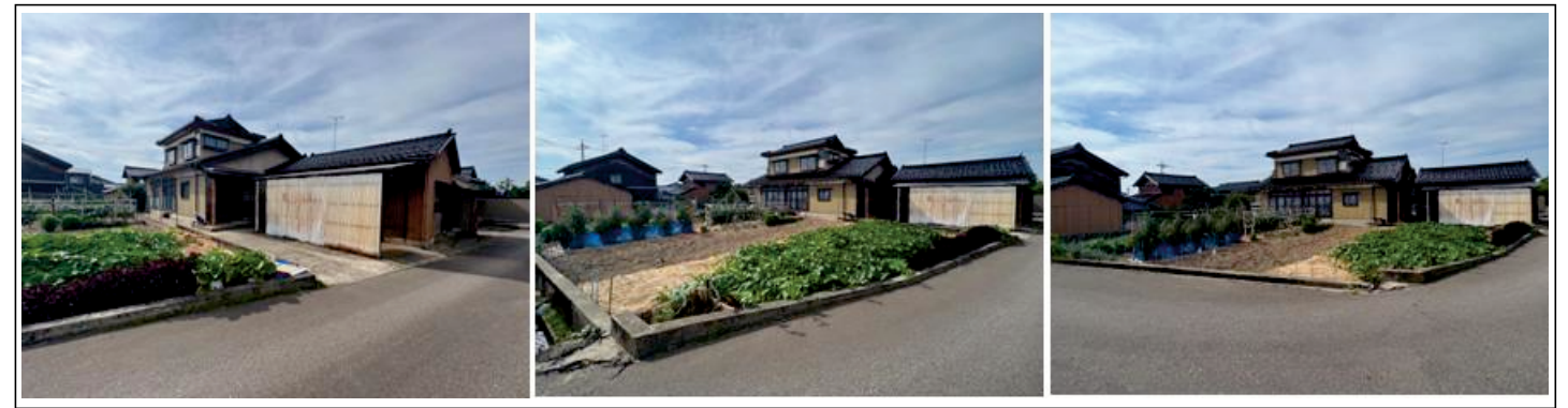
付近見取図・刊広社 (・P)