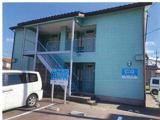
建築年月：1994年6月(築28年)

馬替駅やコンビニが近くて便利な、シングル向けのアパートです。 ネコ1匹飼育が出来るので、このお部屋に住み替えてかわいいネコと一緒に新しい生活を始めてみませんか？