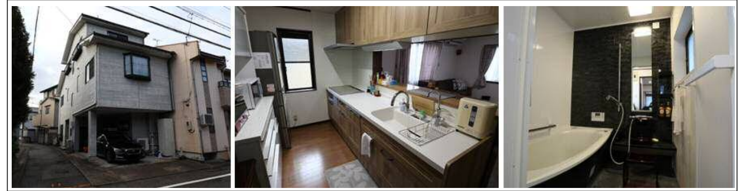
付近見取図・刊社 (北部 P281)