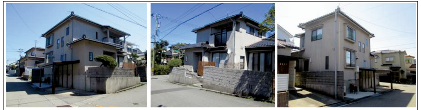
付近見取図・刊社 (南部 P223)