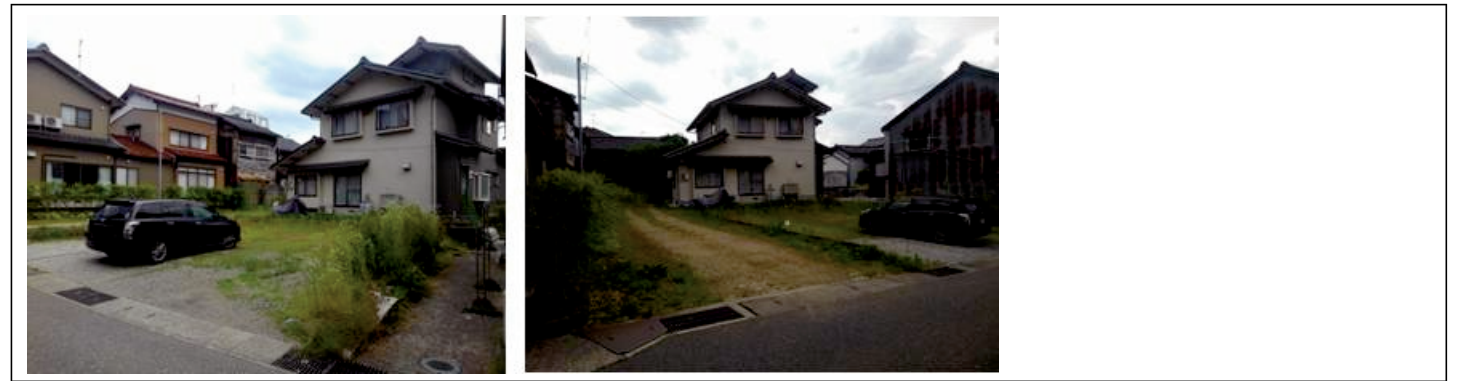
付近見取図・刊広社 (・P)