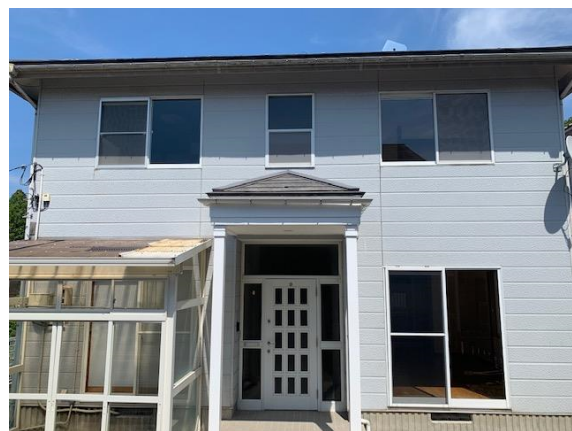
建築年月：1991年5月(築31年)

緑豊かな周辺環境。高台になっているので1階でも日当たり良好です。 内装一部リフォーム済で、即入居できますよ。