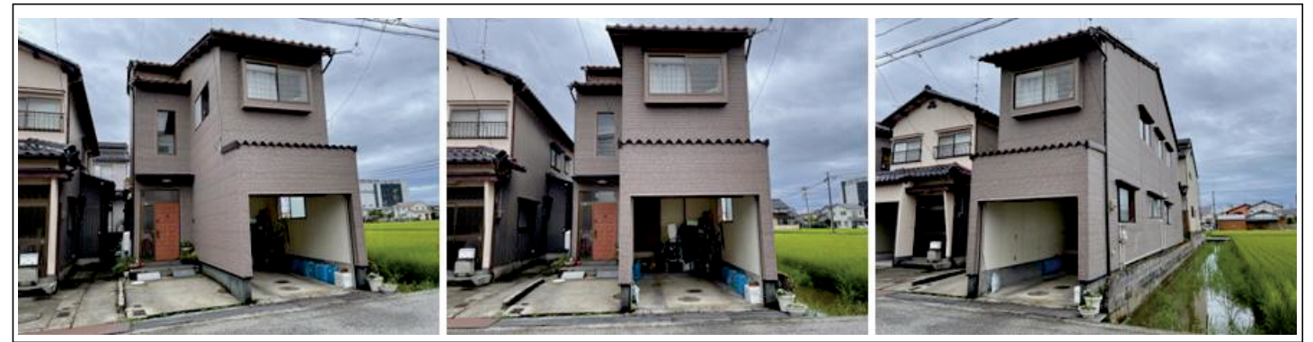
付近見取図・刊社 (-P)